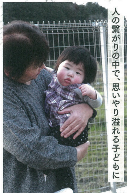
人の繋がりの中で、思いやり溢れる子どもに

空気の澄んだ大自然の中で、思い切り外遊びを楽しむ子どもたちの光景がみられる吉野町。夏は川にでかけたり、湖までサイクリングや虫とりをしたり、秋は紅葉が色づく山々を見ながら収穫のお手伝いをしてみたり。吉野の桜を守る会が行っている「千本桜プロジェクト」では、さくらんぼ拾いから苗作りや植樹を体験でき、自然の営みを感じることができます。