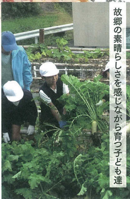
故郷の素晴らしさを感じながら育つ子ども達