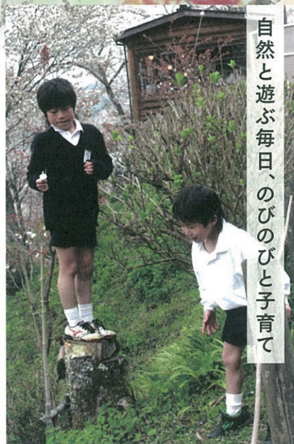
自然と遊ぶ毎日、のびのびと子育て